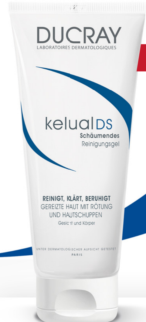
kelual DS Beruhigendes Reinigungsgel