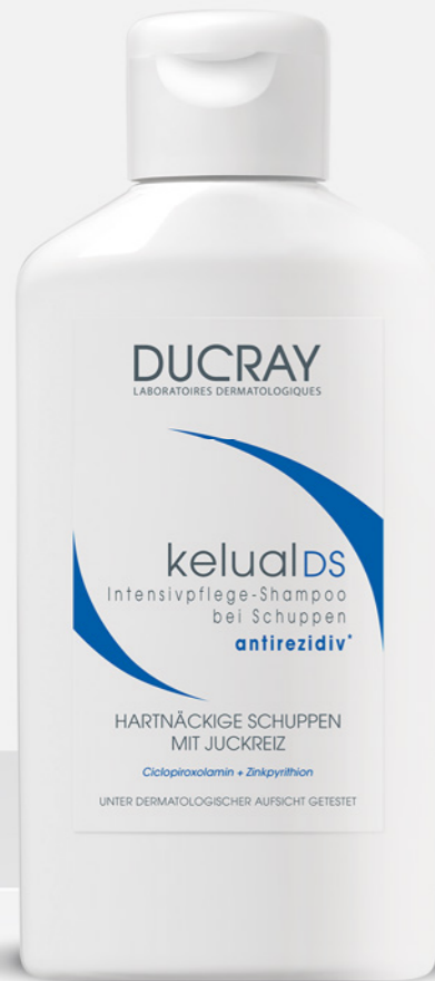
kelual DS Shampoo

*Icomed Studie 2015: Empfehlungshäufigkeit von Shampoos gegen seborrhoische Dermatitis