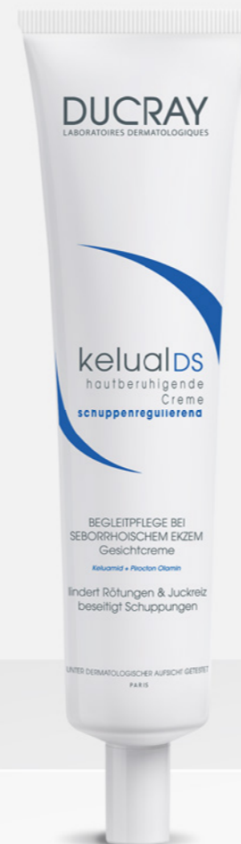
kelual DS Beruhigende Creme